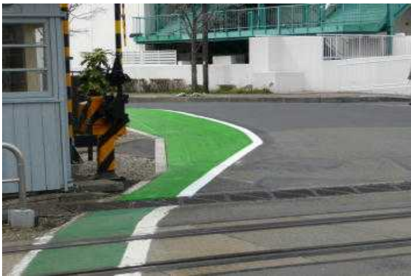
段差を削りグリーンベルトを太くしました

所沢駅前：県道所沢久米線を40年ぶりに側溝改修・舗装直し工事を。周辺町内会が県へ要望を出し実現(西山県議がパイプ役を)