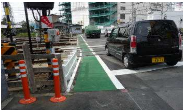
遮断機を少々、左に移動しました