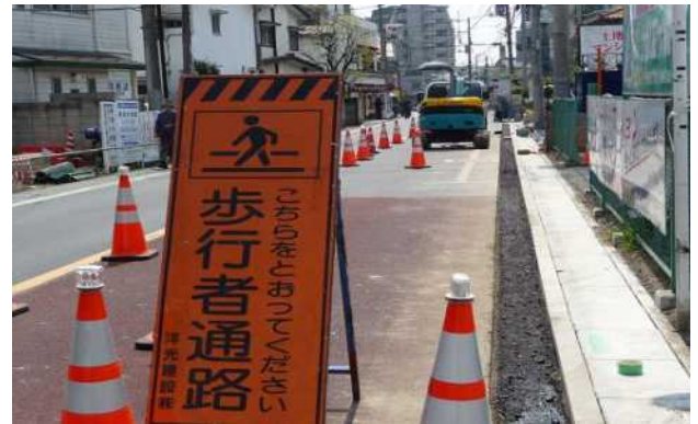
工事中、気をつけて下さい(7月完成予定)

所沢駅前：県道所沢久米線を40年ぶりに側溝改修・舗装直し工事を。周辺町内会が県へ要望を出し実現(西山県議がパイプ役を)