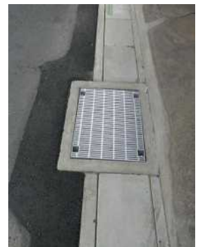
歩きにくい側溝が工事後安全になります