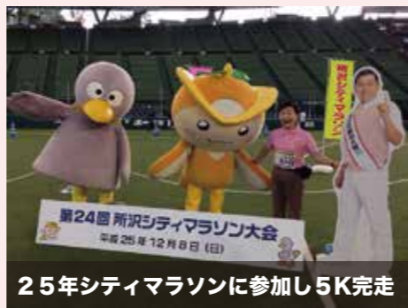
25年シティマラソンに参加し5K完走