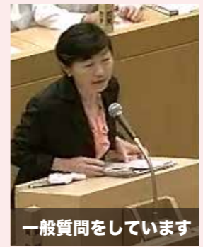
一般質問をしています