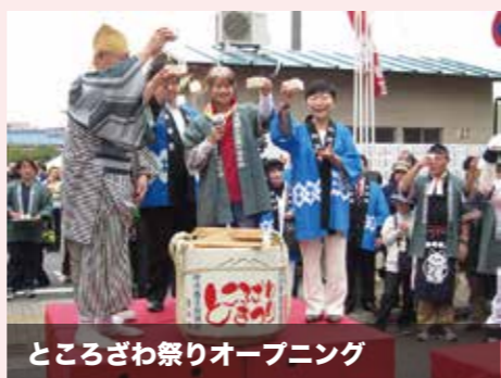
ところざわ祭りオープニング