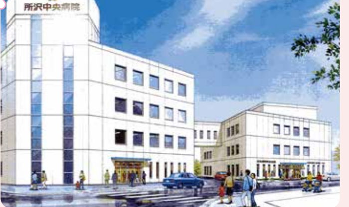
病院①と病院②の完成図

26年12月定例会に、市長提出議案で市の収入として第2市民ギャラリー売却金」が提出され、全会一致で可決しました。 5億2,800万円 購入者は医療法人社団和風会です。