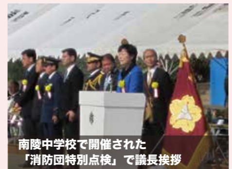
南陵中学校で開催された「消防団特別点検」で議長挨拶

市内にある小・中学校の防音校舎の小・中学校28校に、冷房設備を計画的に設置する事を求める住民投票が、2月15日にあります。 ★2月上旬発行「議会だより」と、「広報ところざわ」号外に詳細は書いてあります。お読み下さい。