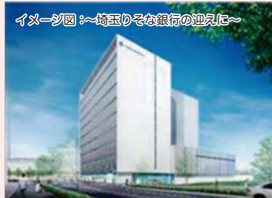
イメージ図:~埼玉りそな銀行の迎えに~

市は約33億円で、東所沢にある浄化センター跡地を売却(市の歳入金となった)売却先は出版大手のKADOKAWA。出版機能の拠点施設を建設し美術館・図書館などの公共貢献施設も建設し、地域解放するそう。900人の雇用を創出する。