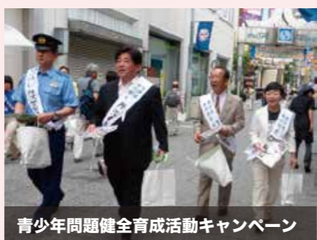
青少年問題健全育成活動キャンペーン