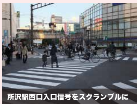
所沢駅西口入口信号をスクランブルに