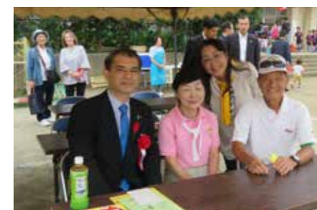
▲吾妻地区ふれあいスポーツフェスティバルで、柴山文科省大臣と一緒に。