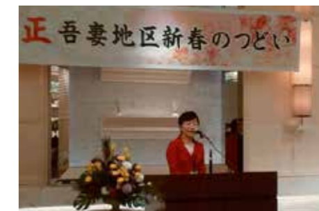
▲平成31年「吾妻地区新春のつどい」で挨拶を。日常的に地域の安心・安全、住み良い地域づくりにご尽力されている方々が、126名参加されました。