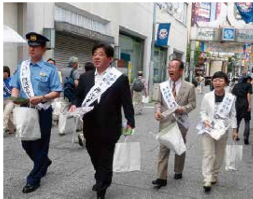
青少年健全育成キャンペーン中