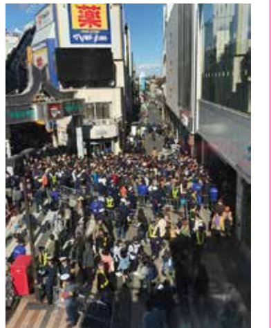
▲11月23日の優勝パレードの様子。これは所沢駅西口の人々です