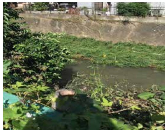
上が木や草がある去年の川底下が掃除後、今年の川底